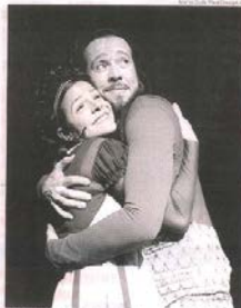
Peça é baseada em livro escrito por Adriana Falcao

Os ingressos têm o valor de R$ 20 e R$ 10 (meio-entrada). O teatro de cultura