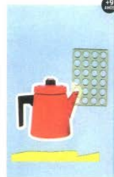
Ilustração de Raul Loureiro para o novo livro do poeta Eucanaã Ferraz

Autor: Eucanaã Ferraz. Ilustrador: Raul Loureiro. Editora Companhia das Letras (2016). 120 páginas. R$ 40,00.